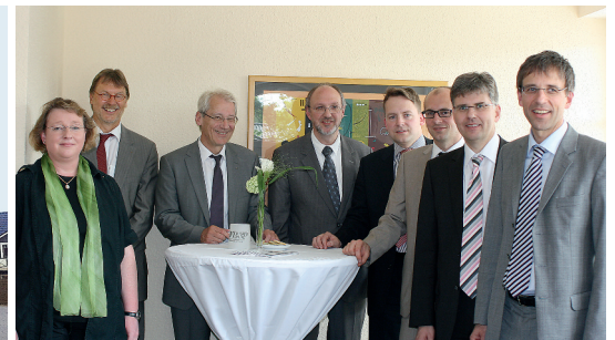
Die Rechtsanwälte der Kanzlei bei der feierlichen Eröffnung der im 1. Obergeschoss des Geschäftshauses Stader Straße 22 gelegenen Zweigstelle der Kanzlei.

➔ Die seit 1985 mit mittlerweile zehn Anwälten in Rotenburg tätige Anwaltskanzlei nahm die immer weiter anwachsenden Beratungsanfragen aus dem Nordkreis Rotenburg zum Anlass, auch in der dortigen Region durch ein Büro präsent zu sein und das in fast allen Fachgebieten vorhandene Fachwissen in einem erweiterten regionalen Umfeld anzubieten.